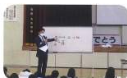
11月10日(火) 深谷小学校 (講師:新、小林上席)