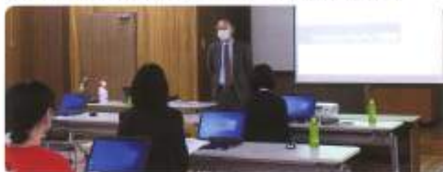
11月18日(水) エクセルレベルアップ講座 場所：ふかや市商工会 本所 2階会議室