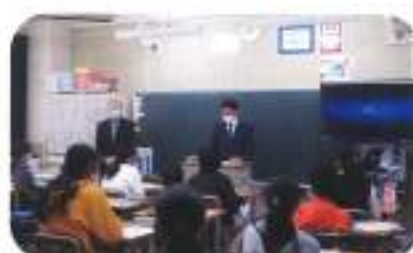
11月25日(水) 妻沼小学校 (講師:春日井、小澤、澤田、野村、小林上席)