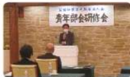
新副部会長閉会挨拶