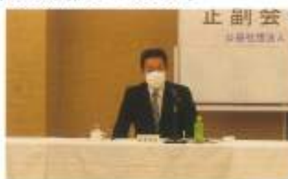
熊谷事務若松本署長ご挨拶