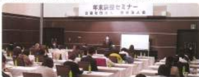
11月6日(金) 年末調整セミナー 場所：ホテルガーデンパレス