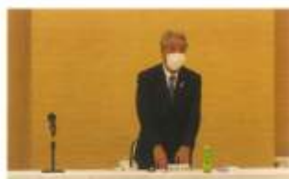
大久保副会長挨拶