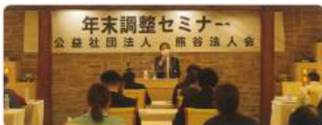
11月12日(木) 年末調整セミナー 場所：埼玉グランドホテル深谷