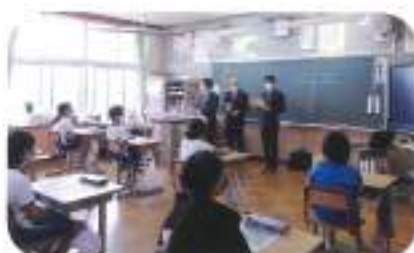
11月20日(金) 藁小学校 (講師:春日井、小澤、野村、清水統括)