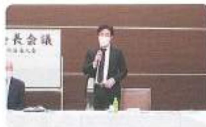
新副部会長閉会挨拶