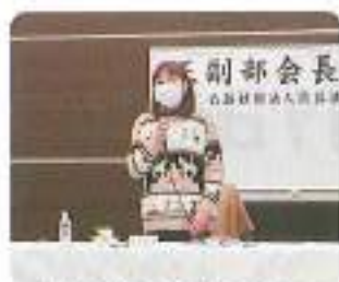
佐伯研修委員長閉会挨拶