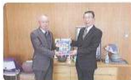
寄居町轟教育長様