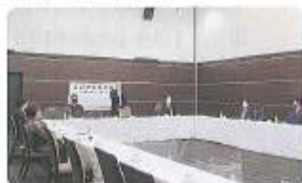
青年部会会議の様子