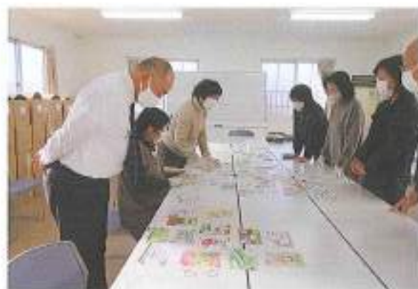
石川先生・女性部会員と真剣に選定中