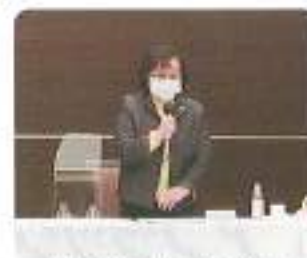
瀬澤親睦委員長閉会挨拶