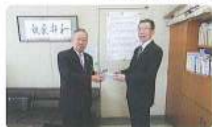
熊谷市野原教育長様