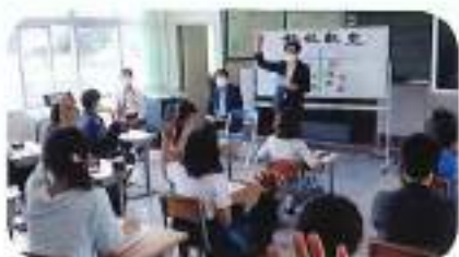
6月18日(金) 根沢小学校 (講師: 松本・柴崎)