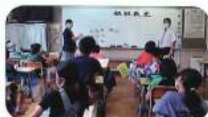
7月1日(木) 鉢形小学校 (講師: 森田・佐伯)

※寄居町内小学校「租税教室」の今後の日程 令和3年12月7日(火) 午前10:30~用土小学校 令和4年1月28日(金) 午後13:40~寄居小学校