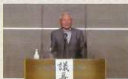
村岡副会長閉会挨拶