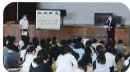
6月17日(木) 男条小学校 (講師: 松本・土鍋)

熊谷法人会寄居支部の青年部会・女性部会の皆さんによる、寄居町内の小学校3校に於いて、「租税教室」を実施致しました。1億円のリプリカ体感コーナーでは、教室内全員が大きな歓声をあげ、楽しい「租税教室」を実施することが出来ました。青年部会員・女性部会員の皆様、お疲れ様でした。