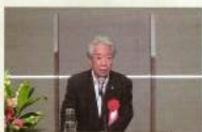
大久保会頭様ご祝辞