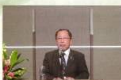
鶴養副会長閉会挨拶