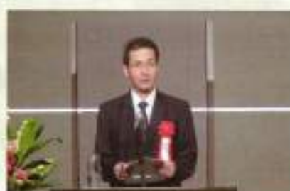
春日署長様ご祝辞