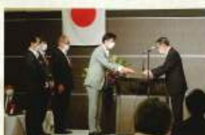
金融機関の皆様感謝状贈呈