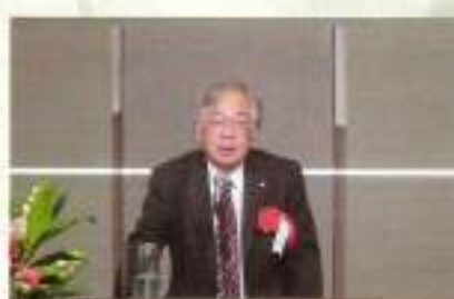
中野支部長様ご祝辞