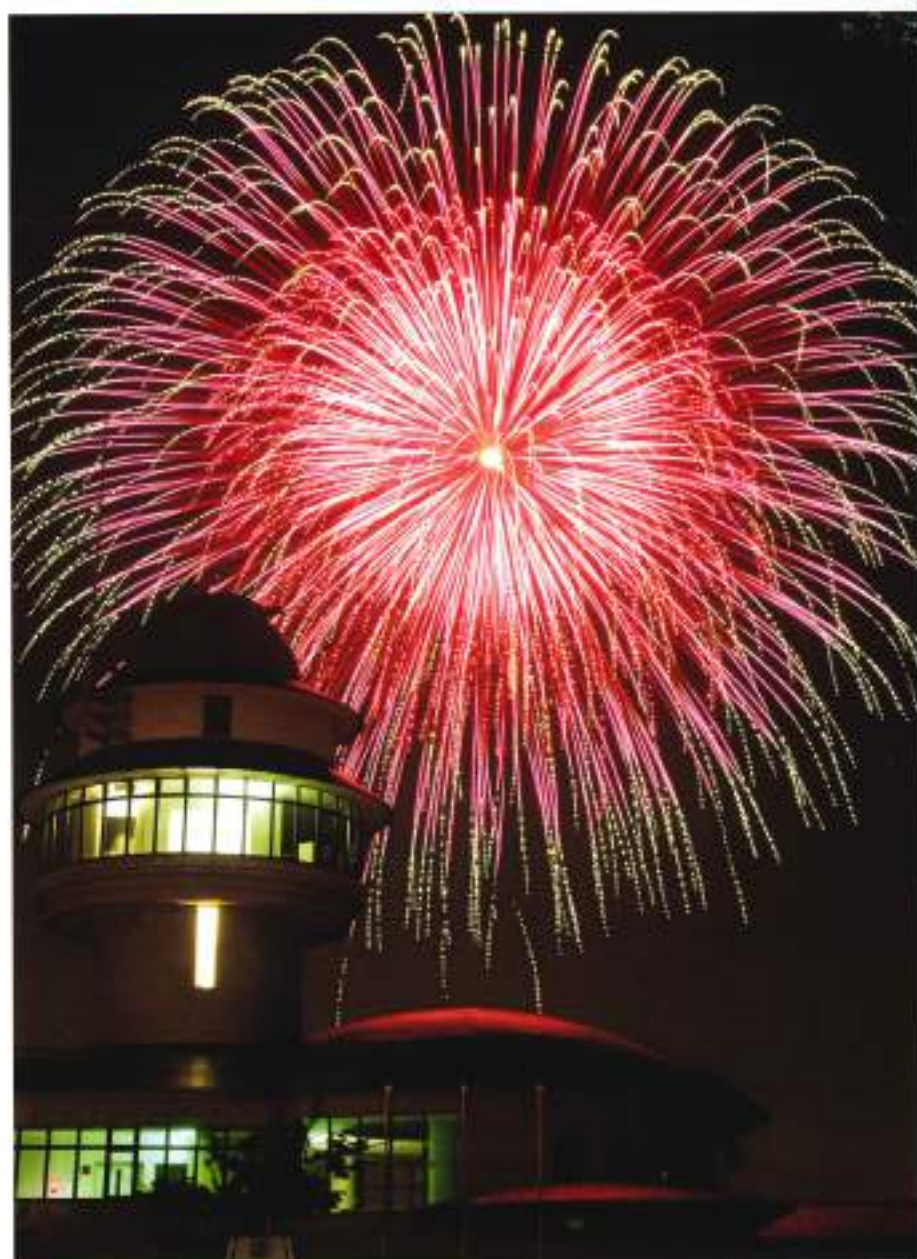
「もくせい館に大輪花咲く」