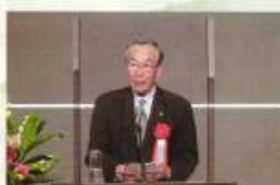
花輪寄居町長様ご祝辞