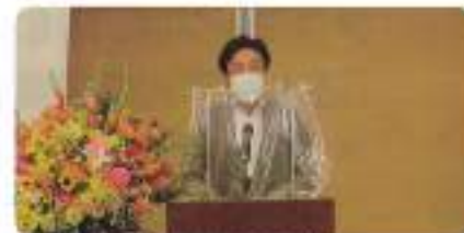
新 青年部会長挨拶