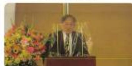
税理士会中野支部長ご挨拶