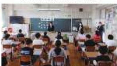
6月20日(月) 桜沢小学校