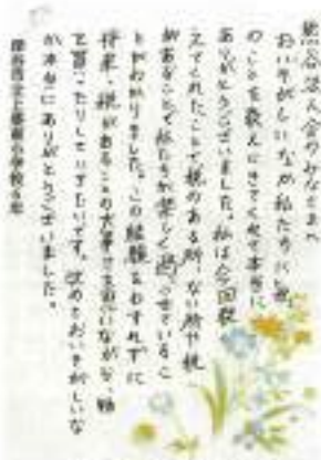
児童からの感想文②

※今日、「租税教室」に参加された上柴東小学校の児童の皆さん60名より、大変温かい感想文を頂戴致しました。「講師の皆さんへの感謝の言葉」と「税金に対する重要さや大切さを学んだ」等々、児童の皆さんが実際に感じたことを文書で表現しており、講師である青年部会員への大きなエールを頂いた感じで、今後の「租税教室」実施に向けて大きな励みとなります。