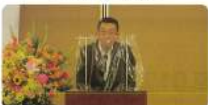
中澤熊谷法人会長ご挨拶