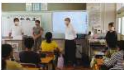
7月1日(金) 鉢形小学校