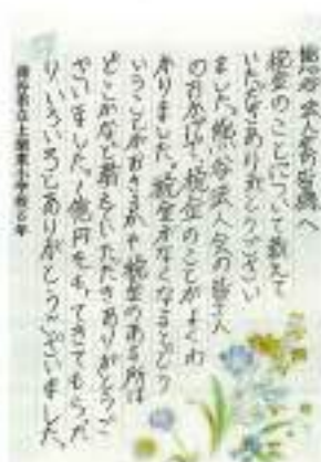
上柴東小学校からの児童感想文①