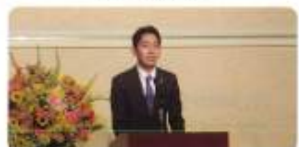
大同生命吉澤所長ご挨拶