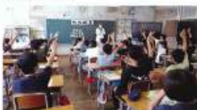
5月30日(月) 中条小学校