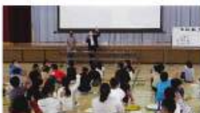
6月14日(火) 川本北小学校