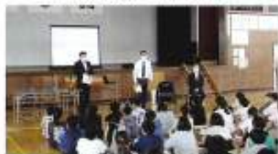
6月16日(木) 男高小学校