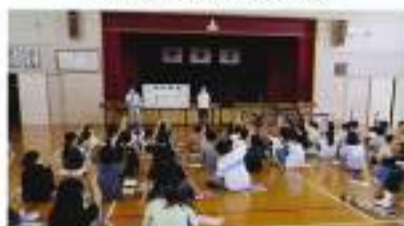
6月27日(金) 上柴東小学校