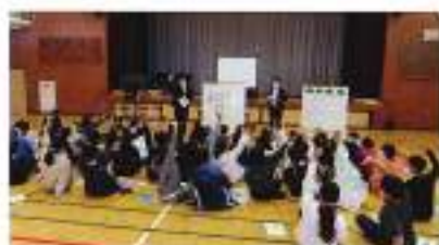
6月8日(水) 桐蔭西小学校