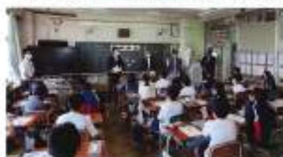
5月24日(火) 市田小学校

熊谷法人会青年部会・女性部会の皆さんにより、熊谷市内2校、深谷市内3校、寄居町内3校の小学校8校に於いて、「租税教室」を実施致しました。 また、1徳円のレプリカ体験コーナーでは、参加児童の皆さん全員が1徳円の重さにピッタリ大きな歓声をあげ、楽しい「租税教室」を実施することが出来ました。 青年部会員・女性部会員の皆さん大変お疲れ様でした。