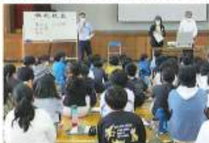
6月16日(金) 男衾小学校