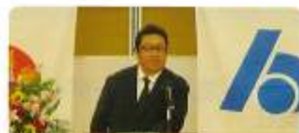
山口部会長新任挨拶