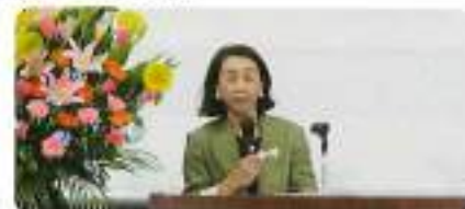
兼原部会長新任挨拶