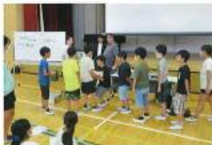
6月29日(木) 玉井小学校