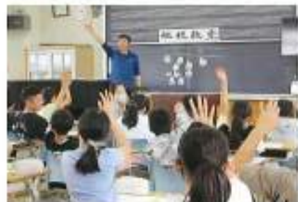
6月23日(金) 岡部西小学校