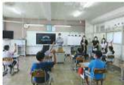
7月3日(月) 折原小学校