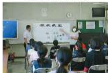
7月6日(木) 用土小学校