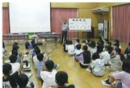
6月20日(火) 川本北小学校